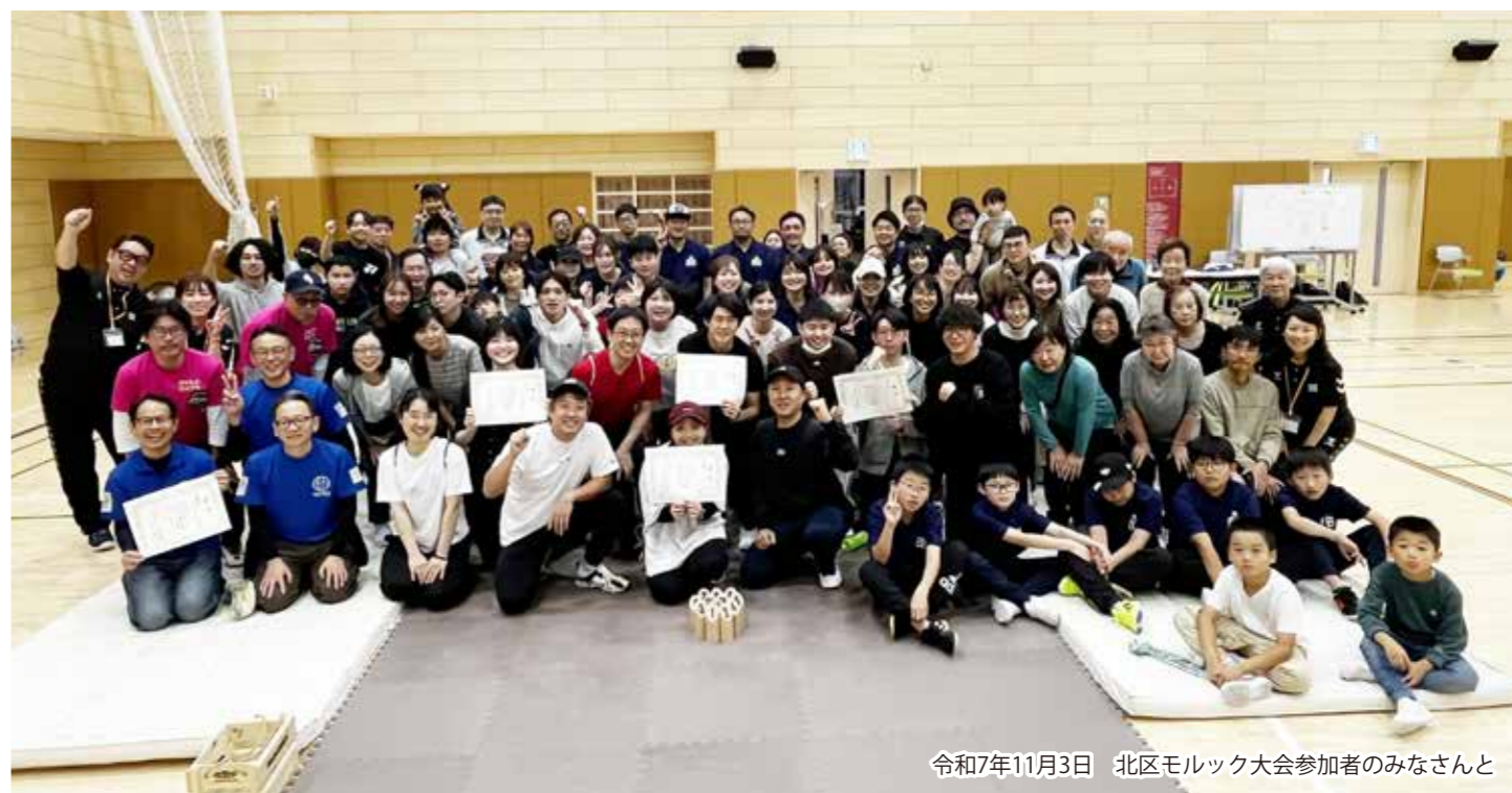
令和7年11月3日 北区モルック大会参加者のみなさんと

地域のスポーツは、参加する人だけでなく、ささえる人によって成り立っています。北区スポーツ推進委員協議会では、区民の皆さんが気軽に体を動かせる場づくりを続けてきました。イベントや教室、体験会を通して、世代を超えた交流が生まれています。スポーツを「する人」「ささえる人」「つなぐ人」、そのすべてが地域の元気をつくっています。これからも北区の皆さんとともに、身近で続けられるスポーツ環境を広げていきます。