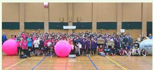
● 北区キンボールスポーツ交流大会「KITA-CUP2019」出席者一同

令和元年度は「楽しいキンボールスポーツ」、「親子でできるキンボールスポーツ」を目指し、地域や学校と連携しながら講習会の依頼に応える活動をしてきました。6月には、委員会のメンバーのスキルアップのためキンボールスポーツ普及者(リーダー)の資格を得るための講習会と区民を対象としたミニ大会を開催しました。また、多くの方々の協力もあって、北区スポーツ推進委員