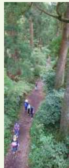
● 箱根旧街道を歩く

上記のようなイベントを年間2回実施する他に、区内各所でノルディックウォーキングの出前教室も随時受け付けています。専用のボールを用いたの全身運動で、普通のウォーキングの約1.4倍のカロリー消費が期待できますので、日常的に運動ができていない方や、足腰に不安を抱えている方にも最適なスポーツです。今後もただ歩くだけでなく、親子で気軽に参加できるウォーキングと体験学習を組合せたイベントを企画して参ります。詳細は北区ニュースや当協議会HP・Facebookにて公開しますので、是非ご参加頂きますようお願い申し上げます。