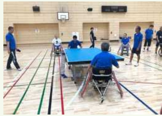
● 競技用車いすに乗って卓球体験

北区には今回訪問した東京都障害者総合スポーツセンターを始め、沢山のスポーツ施設があり、そして私たちスポーツ推進委員が全ての方にスポーツする喜びを感じてもらうために日々活動をしています。今後もご期待ください。