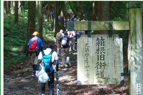
● 箱根旧街道を歩く

私たち健康ハイキング委員会は、関東近郊での軽登山や、近場でのお手軽なウォーキングなどの企画・運営に携わっています。令和元年度は9月に箱根旧街道の石畳を歩きました。また、2月にはメッツァビレッジでノルディックウォーキングを体験した後、隣接のムーミンバレーパークを散策する親子向けのイベントを開催いたしました。