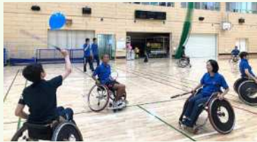
● 競技用車いすに乗って風船バドミントン体験

楽しむことはできないかを検証するためです。献身的な指導を受け、身体はボロボロながら一通り車いすを操れるようになった後は、手にラケットを持ち卓球や風船バドミントンを体験し、車いすの操作とラケットの扱いの両立に悪戦苦闘しました。そして、キンボールスポーツに関しては現行のルールをそのまま運用すると難しい部分もありましたが、ツウバウンド以内にキャッチする等、ルールを柔軟にすることで車いすに乗りながらでも十分楽しむことができ、キンボールスポーツの新たな可能性を見出すことができました。今後もパラキンボールスポーツを研究していきます。