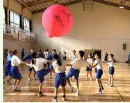
● キンボールスポーツキャラバン

活動地域は滝野川、田端、西ヶ原になります。この地域で様々なスポーツイベントを行っておりますので自治会掲示板、回覧板、北区ニュース等をご覧の上、是非ご参加ください。またこの地域には総合型地域スポーツクラブの「コムスポたきのがわ」もございます。私たちはそちらのバックアップも含めて滝野川地区のスポーツや文化事業を盛り上げて参りますのでよろしくお願い致します。