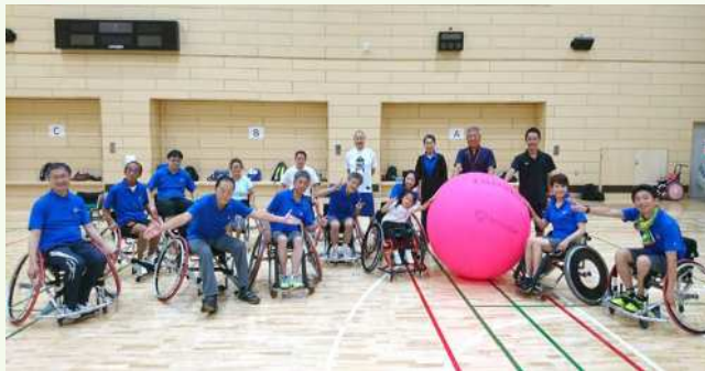
● 東京都障害者総合スポーツセンターの設備と一緒に

北とびあを背にして、坂道を登り真っ直ぐ歩くこと15分。東京に2箇所しかない障害のある方専用のスポーツ施設である「東京都障害者総合スポーツセンター」が北区にあります。東京2020大会に合わせて施設は大幅にリニューアルして、トラックは200mの立派な全天候型トラックです。その東京都障害者総合スポーツセンターでパラスポーツの体験をしました。目的の一つは「障害のある人となない人の垣根を超えて共にスポーツを楽しむ」ためにまず自らがパラスポーツを体験すること。もう一つは私たちのメイン競技であるキンボールスポーツを車いすに乗りながら