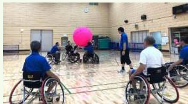
● 競技用車いすでキンボールスポーツを実践

北とびあを背にして、坂道を登り真っ直ぐ歩くこと15分。東京に2箇所しかない障害のある方専用のスポーツ施設である「東京都障害者総合スポーツセンター」が北区にあります。東京2020大会に合わせて施設は大幅にリニューアルして、トラックは200mの立派な全天候型トラックです。その東京都障害者総合スポーツセンターでパラスポーツの体験をしました。目的の一つは「障害のある人となない人の垣根を超えて共にスポーツを楽しむ」ためにまず自らがパラスポーツを体験すること。もう一つは私たちのメイン競技であるキンボールスポーツを車いすに乗りながら