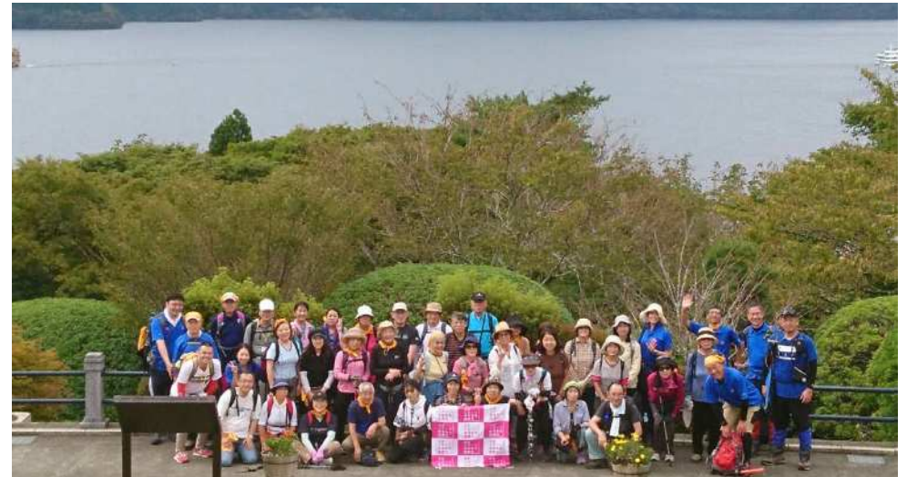
健康ハイキング 芦ノ湖にて

さて、本年度も北区スポーツ推進委員協議会では「スポーツ・イン・ライフ」、生活の中にスポーツがある環境を皆様に提供するため、魅力あるプログラムを用意しています。皆様のご参加を心よりお待ちしております。