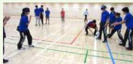
● ブラインドサッカー体験

赤羽地区長として早2年が経ちました。昨年度から計画を練っていた、バラスポーツ体験会を7月に開催し、ブラインドサッカーや絆伴走を通