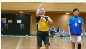
● キンボールスポーツ審判

地域との連携として、ここ数年続いている田端地区委員会の開催する体験会や滝野川地区の六つの小中学校の連合会(六校連)の保護者と教職員の大会の運営やレフリーのほか、定時制高校からの講習会の依頼など新しい展開もありました。さらなる展開として、田端地区の三校連でもキンボールスポーツ大会の開催を目指してPTA会長と検討しています。今後もキンボールの楽しさを区民に感じてもらえる活動に取り組んでいきたいと思ひます。