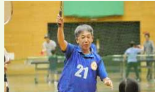
● MIRAIフェスバドミントン教室